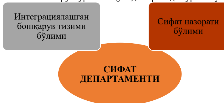
1-расм. Сифат департаменти ташкилий структураси 1

Корхонада сифат департаменти яна бир нечта бўлимларга таснифланиб, шундан фақат иккита бўлим умумишлаб чиқариш хўжалиги таркибига киради. Сифат департаментининг ташкилий структурасини қуйидаги расмда кўриш мумкин: