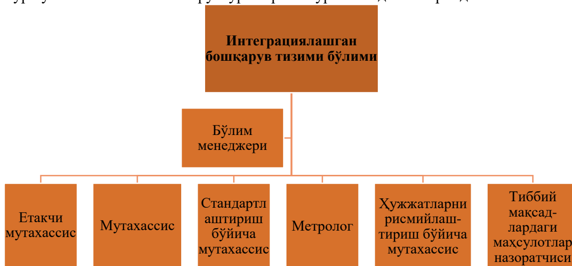
2-расм. Интеграциялашган бошқарув тизими бўлими ташкилий структураси 1

Умумишлаб чиқариш хўжалиги таркибига кирувчи сифат департаментининг биринчи бўлими бу интеграциялашган бошқарув тизими бўлими (ИСМ) бўлиб, ушбу бўлим дори воситалари ишлаб чиқариш жараёнларига билвосита таъсир қилади. Қуйида мазкур бўлимнинг ташкилий структураси расм кўринишида келтирилди: