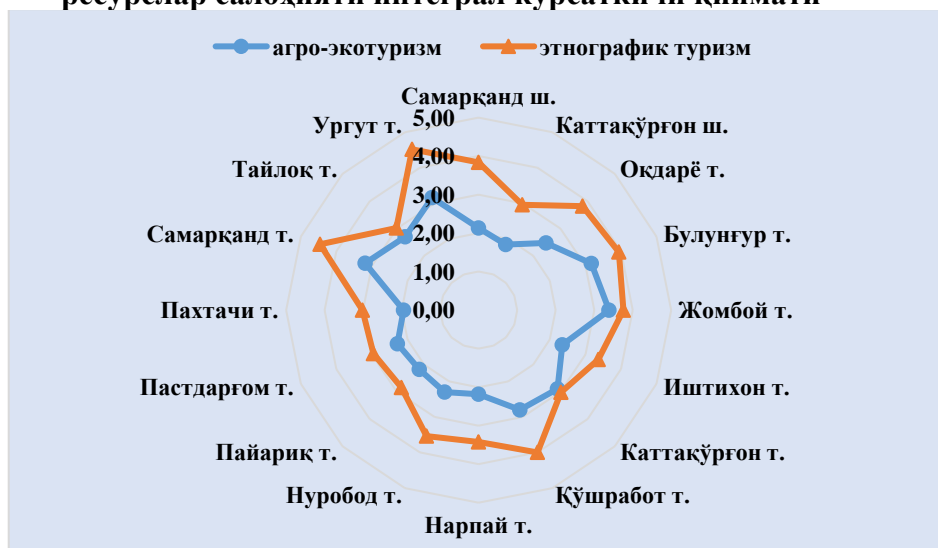
3-расм. Этнографик ва агро-эко туризм бўйича ҳудудий туристик ресурслар салоҳияти интеграл кўрсаткичи қиймати