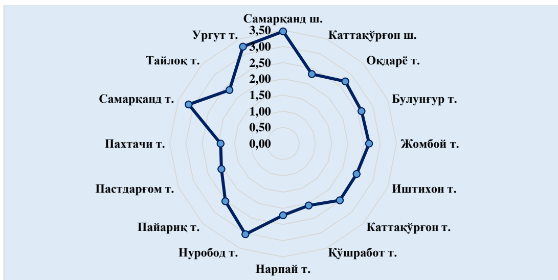
1-расм. Самарқанд вилояти ҳудудий туристик ресурслар салоҳияти интеграл кўрсаткичи қийматлари