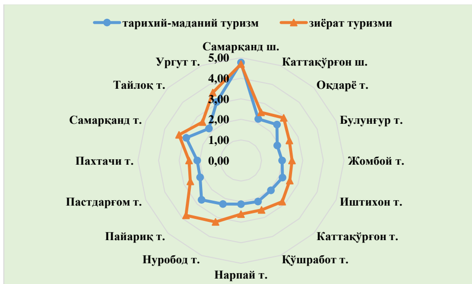
2-расм. Тарихий-маданий ва зиёрат туризми бўйича ҳудудий туристик ресурслар салоҳияти интеграл кўрсаткичи қиймати