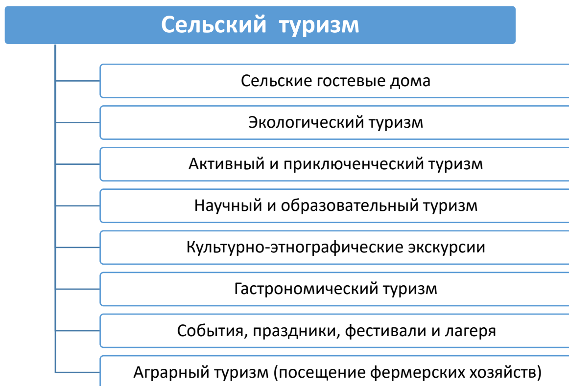
Схема №1. Классификация сельского туризма 2

Далее хотелось бы обратить внимание на следующую классификацию сельского туризма, которая представлена в работе Лебедева И.В., Копылова С.Л. 1 [4] в виде следующей схемы: