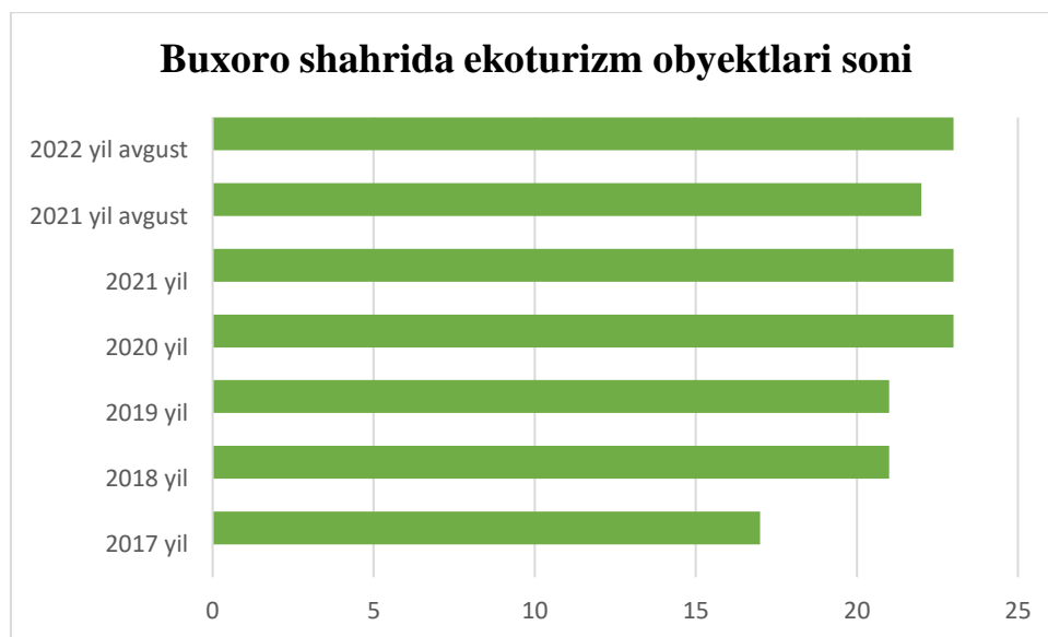
1-grafik. Buxoro shahrida ekoturizm obyektlari ko'rsatkichlari (2017-2022 yillar).

Jumladan, aynan Buxoro shahrida joylashgan ekoturizm obyektlari sonini 2017-2022 yillar oralig'ida tahlil qiladigan bo'lsak ular sonini 17 tadan 23 taga oshganini ko'rishimiz mumkin(1-grafik).