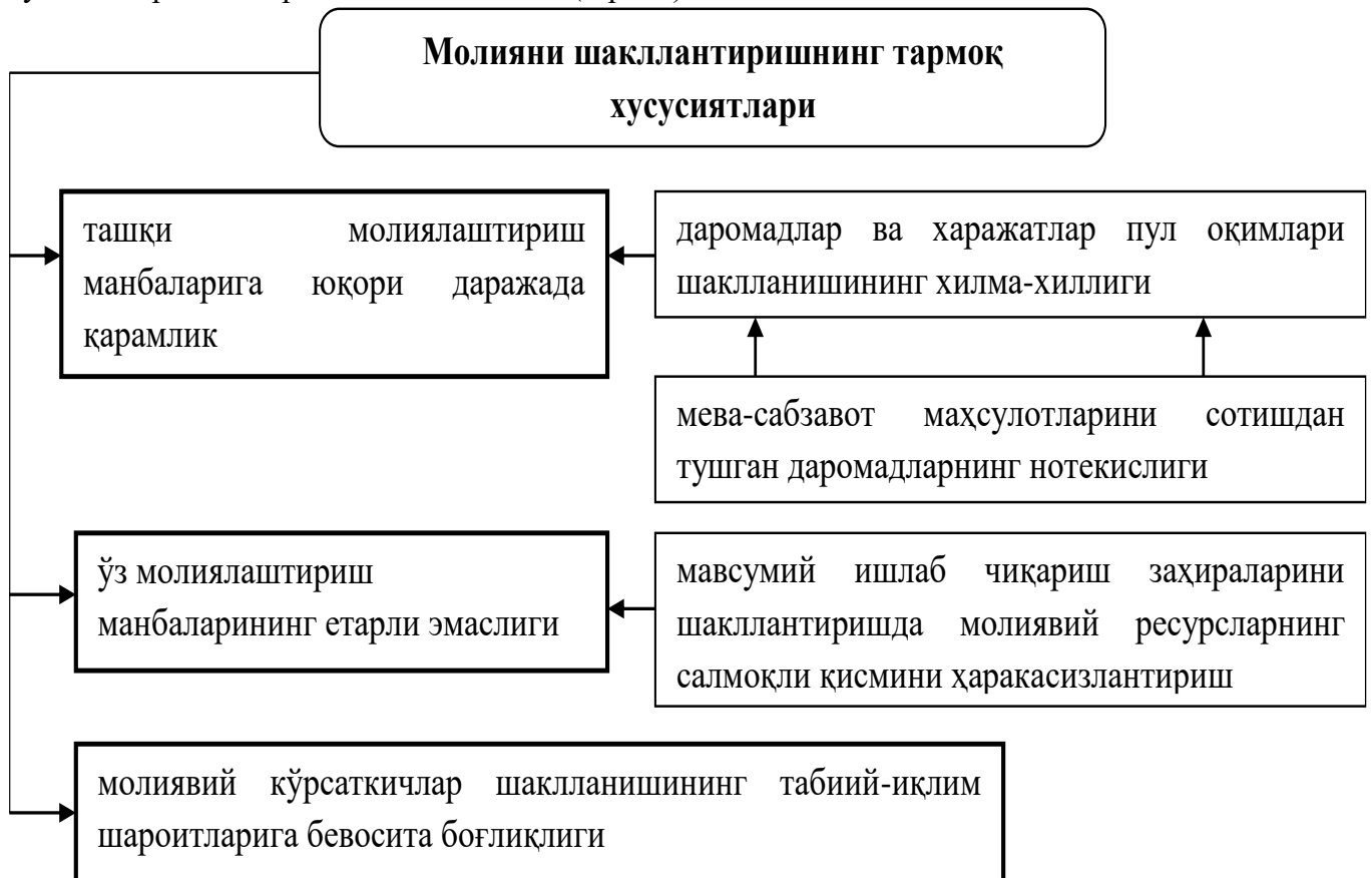
1-расм. Мева-сабзавот корхоналар молиясини шакллантириш хусусиятлари 1

Бу жараёнларнинг давомийлиги қишлоқ хўжалигини, хусусан мева-сабзавотчиликни ривожлантиришнинг истиқболли режалари бажарилиши устидан доимий мониторинг ва тузатишлар олиб боришни таъминлайди (1-расм).