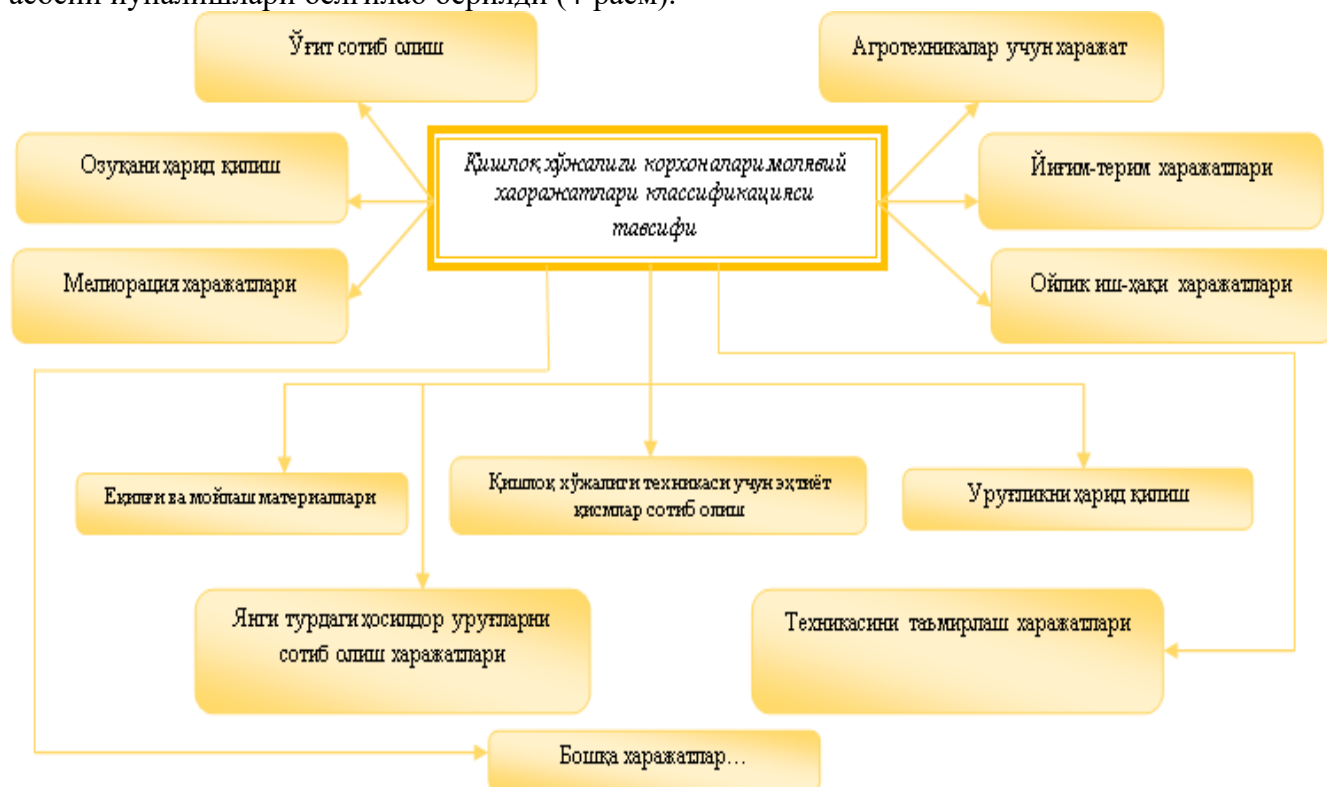
4-расм. Қишлоқ хўжалиги соҳасида хўжалик юритувчи субъектлар харажатлар тақсимоги тавсифи 1

Иқтисодиётнинг мева-сабзавот корхоналари томонидан молиядан фойдаланишнинг асосий йўналишлари белгилаб берилди (4-расм).