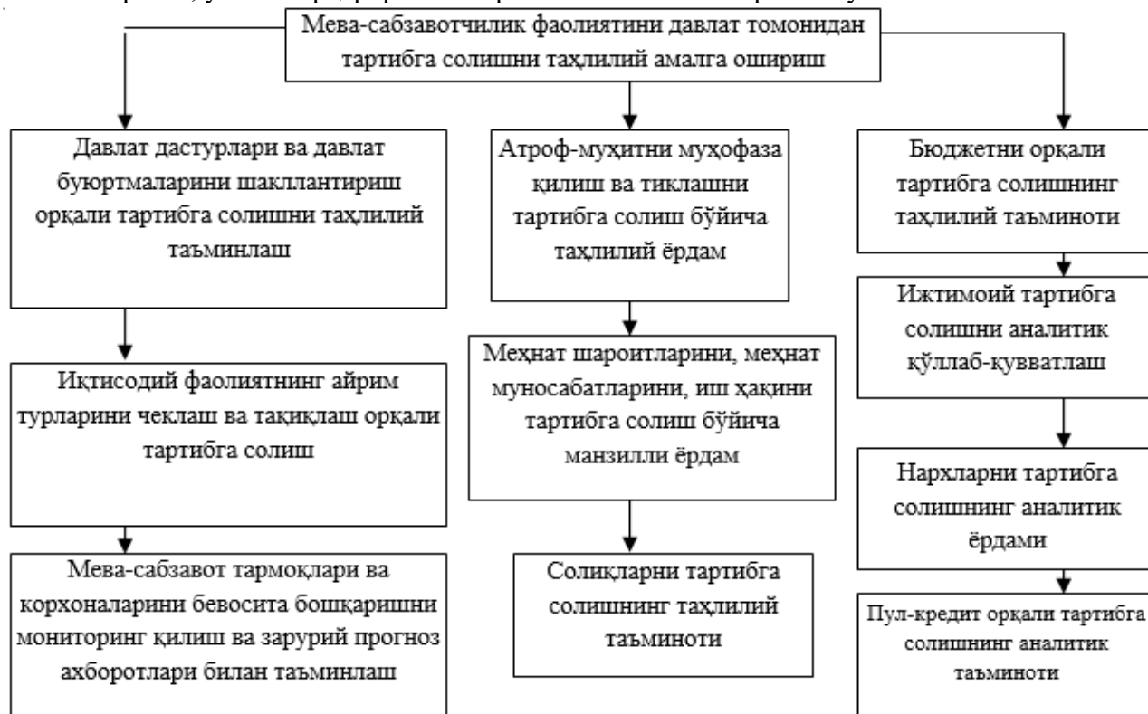
3-расм. Мева-сабзавотчиликни давлат томонидан тартибга солишнинг энг муҳим шакллари қамраб олувчи таҳлилий қўллаб-қувватлаш тизими 1

Умуман олганда, боғдорчиликни молиялаштиришни давлат томонидан қўллаб-қувватлаш мева-сабзавот етиштирувчилар учун хавфларни камайтириш ва молиялаштириш имкониятларини оширишга ёрдам беради, бу эса ушбу соҳанинг ривожланишини рағбатлантириши, унинг барқарорлиги ва рентабеллигини ошириши мумкин.